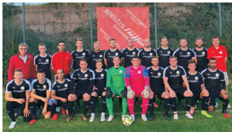
Die Probsteier SG