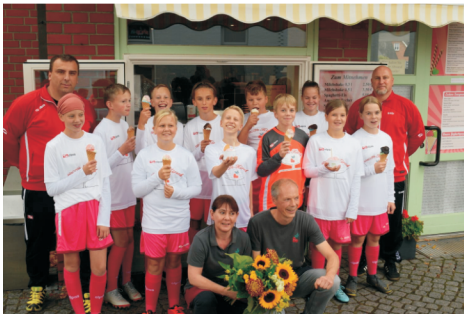
D 3/4: Trikotübergabe Eiscafe Kirsch