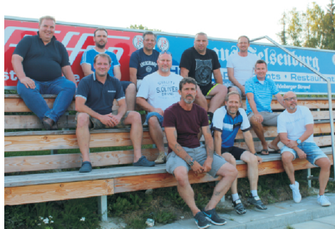
Trainertreffen der neugegründeten SG "Team Probstei"

„Nichts ist so beständig wie die Veränderung“. Dieser Spruch aus dem echten Leben macht auch in der Sportgemeinschaft nicht halt.