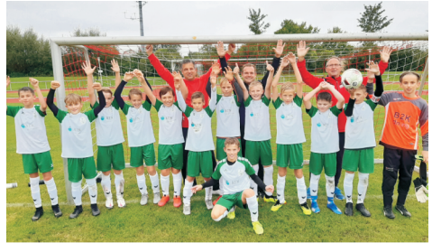
D1: Erfolgreiche Qualifikation Verbandsliga