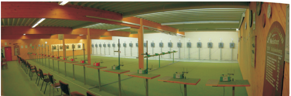
Der Luftgewehrstand mit 20 Ständen oder nach Umbau mit 5 Ständen für Zimmerstutzen.

In unserem Schützenheim befinden sich zwei Schießstände. Zum einen die 10 m Luftgewehr-Anlage mit 20 Ständen. Hier findet das Training mit dem Luftgewehr und Luftpistole statt. Jeder Stand ist mit einer Auflage umrüstbar, so dass auch die Auflageschützen nicht zu kurz kommen. Um auch die Disziplinen mit dem Zimmerstutzen üben zu können, lässt sich die Luftgewehr-Anlage nach ein paar Handgriffen auch quer verwenden. In diesem Fall stehen 5 Stände mit einer Entfernung von 15 m zur Verfügung.